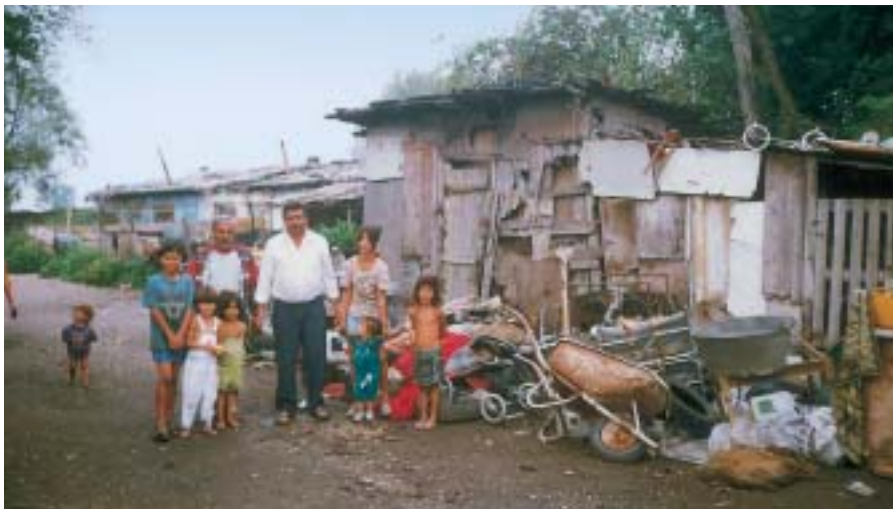
Detalj iz Struga, jednog od zagrebačkih romskih naselja

nalnog programa. Mak tvrdi da je u rješavanju romskih problema Hrvatska danas ispred nekih europskih zemalja koje su nedavno ušle u Europsku uniju, te da Hrvatska do 2007. ima obvezu EU dati konkretne primjere uspješne politike prema Romima, što će biti i značajan doprinos hrvatskom uključivanju u Europsku uniju.