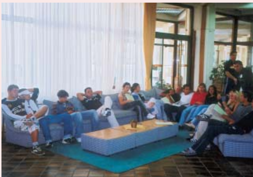
Grupa mladih Roma, polaznika seminara u Varaždinskim toplicama, snimljena za vrijeme pauze između dvaju predavanja