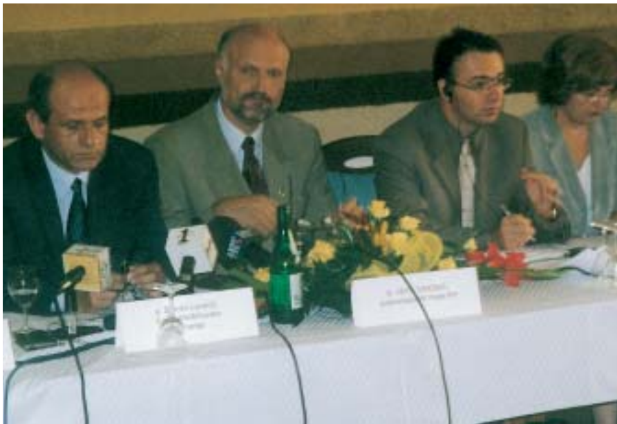
Michael Guet (treći slijeva), voditelj Odjela za Rome i nomade Vijeća Europe, sudjelovao je prije dvije godine u Zagrebu na savjetovanju o pravima nacionalnih manjina