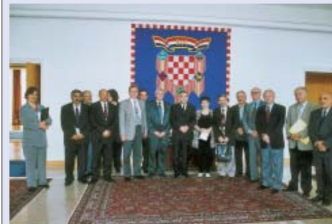
Predsjednik Mesić često iskazuje pozornost za problematiku nacionalnih manjina u našoj zemlji. Na slici: Predsjednik sa predstavnicima nacionalnih manjina

Predsjednik Stjepan Mesić primio je 29. ožujka izaslanstvo Centra za ljudska prava koje ga je izvijestilo o svom dosadašnjem radu. Naglašeno je da je Centar postao mjesto gdje predstavnici Vlade, nevladinih organizacija, akademske zajednice i međuna-