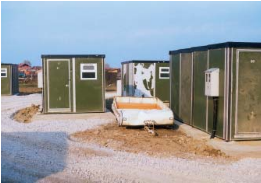
Ove "limene kante" bile su ponudene Romima za smještaj, ali oni su to s pravom odbili

ja bila što stanovnici tog "hrvatskog naselja" nisu od prvog dana prihvaćali da im "cigansko naselje" bude u neposrednom susjedstvu. I jedni i drugi imali su svoje motive i opravdavali svoje zahtjeve: Romi su tvrdili da su oni na tom prostoru već dvadesetak godina, a doseljenici su govorili da su oni sami, svojim novcima, sagradili svoje kuće. Bilo je tu i nacionalističkih ispada, a izbilo je i nekoliko tučnjava.