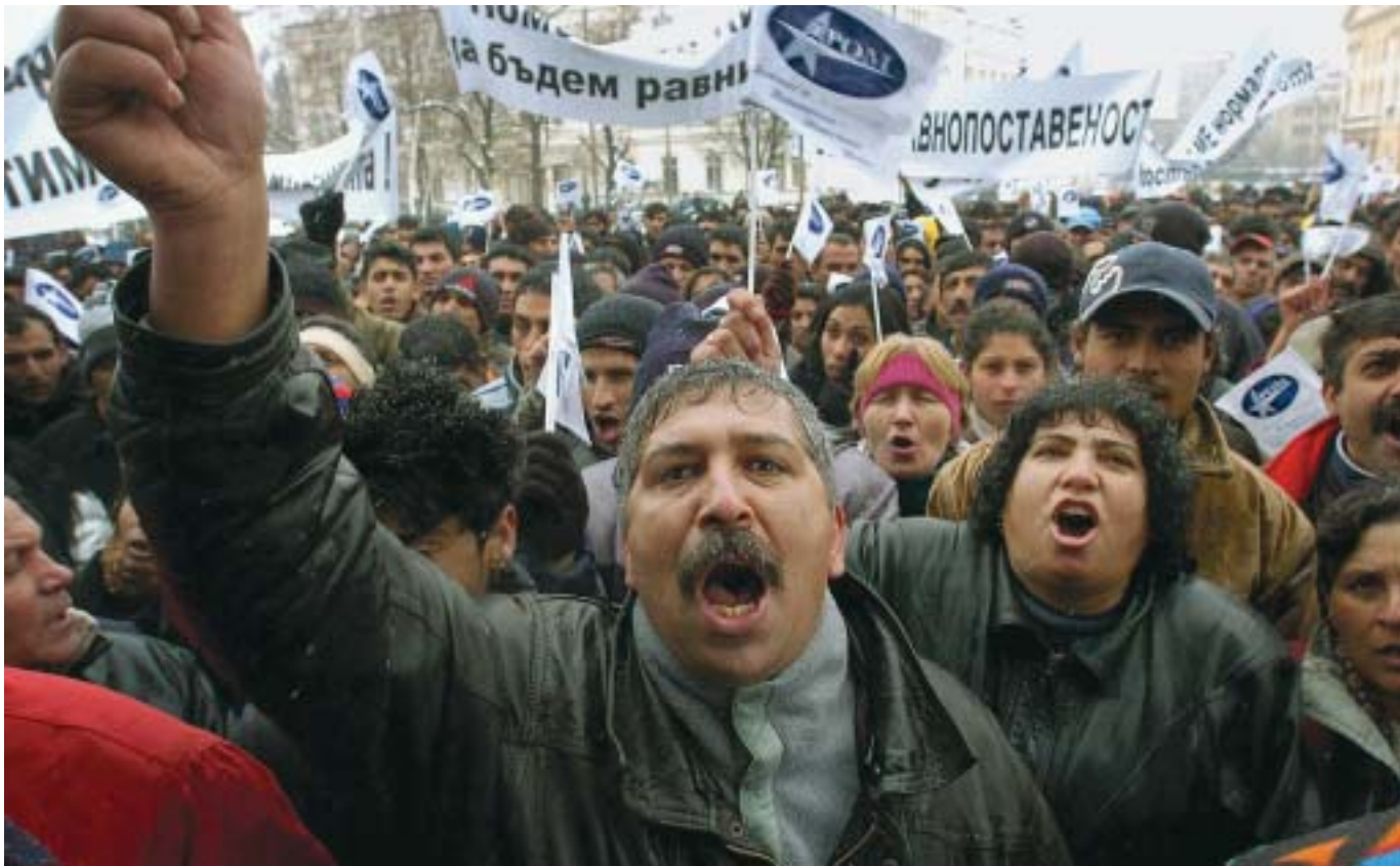
Tisuće bugarskih Roma oduševljeno su pozdravili u Sofiji predstavnike osam zemalja, među kojima je i Hrvatska, koje su pokrenule inicijativu za osnutak programa dugoročne akcije "Desetljeće Roma"