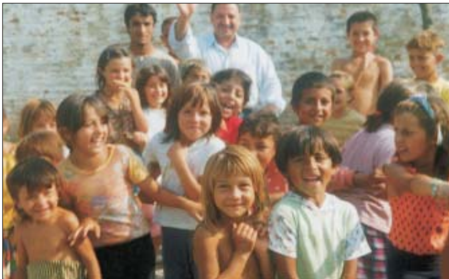
Skupina razdraganih malih Roma iz Međimurja, dijela Hrvatske s najbrojnijom romskom populacijom

Roma, a samo ih je 6,5 posto stalno zaposleno. Na županijskoj razini, najveći broj romske populacije živi u Međimurskoj županiji - njih 2887 ili 30,5 posto, što čini 2,4 posto stanovništva županije. Slijede Grad Zagreb s 1946 ili 20,6 posto te Osječko-baranjska županija sa 10,3 posto ili 977 Roma. Dakle, otprilike polovina svih Roma Hrvatske živi u Međimurju i Zagrebu. U međupo-